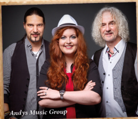
Andy's Music Group